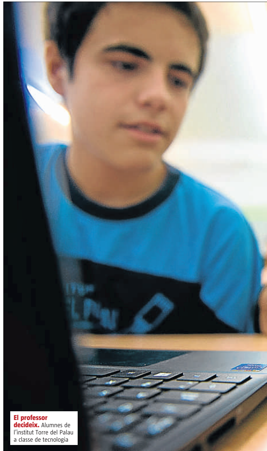
El professor decideix. Alumnes de l'institut Torre del Palau a classe de tecnologia